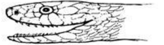
A: Zehirsiz yılan ısırık izi